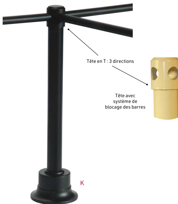
Potelet pour barres