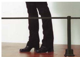
Socle lesté pouvant être fixé au sol