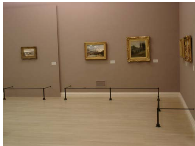
Musée des Beaux-Arts de Rouen

Caractéristiques : potelet laiton et cuivre laqué noir. Socle lesté pouvant être fixé au sol (Ø 10 cm). Barres transversales (Ø 16 mm). Finition : peinture époxy cuite au four haute résistance. Sur demande : réalisation en teinte nuancier RAL de votre choix. Hauteur : 40 cm. Dim. socle : H 6 cm, Ø 10 cm. Poids : 2,30 kg.